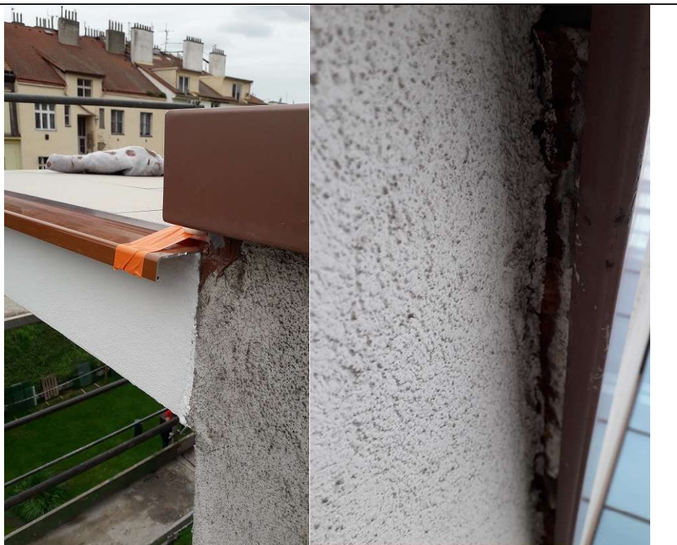
Foto 2 : Po zpětné montáži plechů zůstává pod parapety viditelná spára (nutné zapravit a opatřit fin. vrstvou omítky)

Foto 1 : Detail zakončení lemovacího plechu (nutná ukončovací krytka)