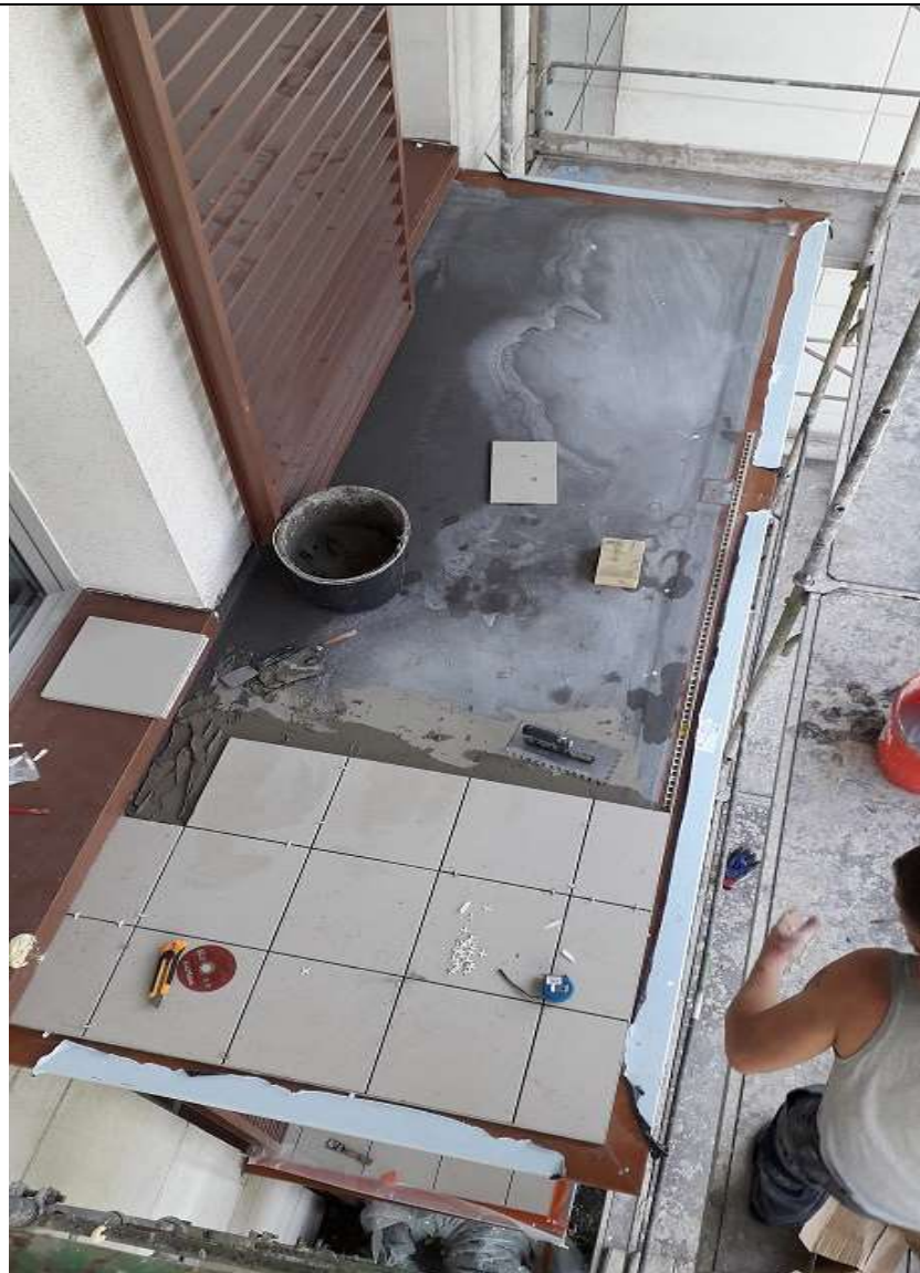
Pokládka dlažby – kontrola rovinatosti (sekce H1)